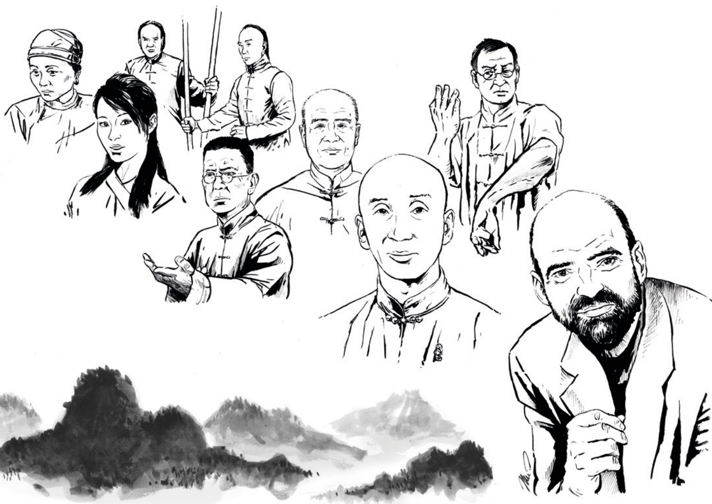
Tradiční linie našich velmistrů