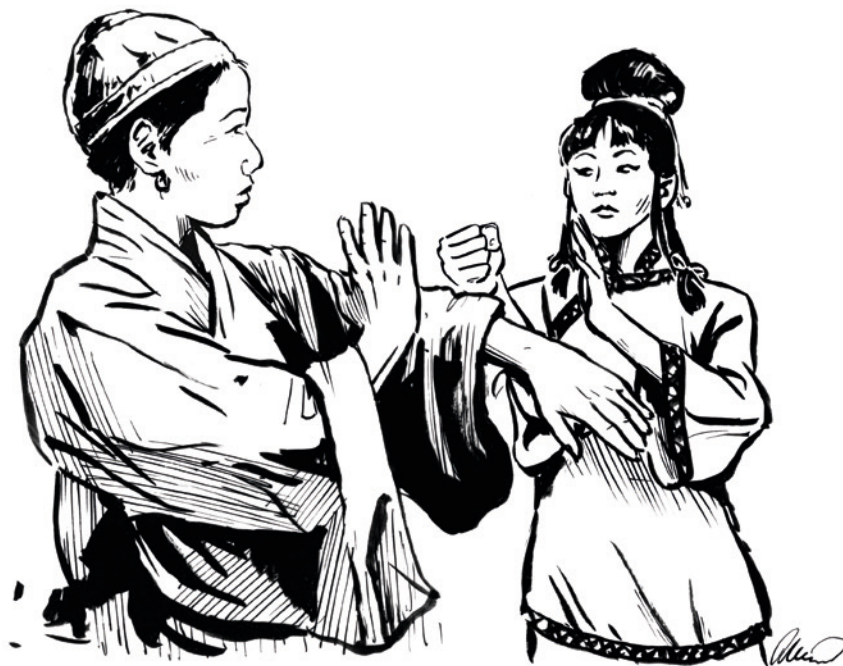
Je možné, že Wing Tsun byla jediná, nebo nejoblíbenější studentka Ng Mui , a proto jí tajně ukázala svoji nově vyvinutou a ještě bezejmennou Kung Fu techniku

ještě velmi „ šaolinské “ Weng Chun s jeho hlubokými a dlouhými postoji atd. Byl veslařem džunky a expertem techniky dlouhých holí, která se pravděpodobně velmi podobala Hung Gar . Poznal Wong Wah Boa a jeho Wing Tsun ho fascinovalo. Cítil, že je jasně lepší než Weng Chun