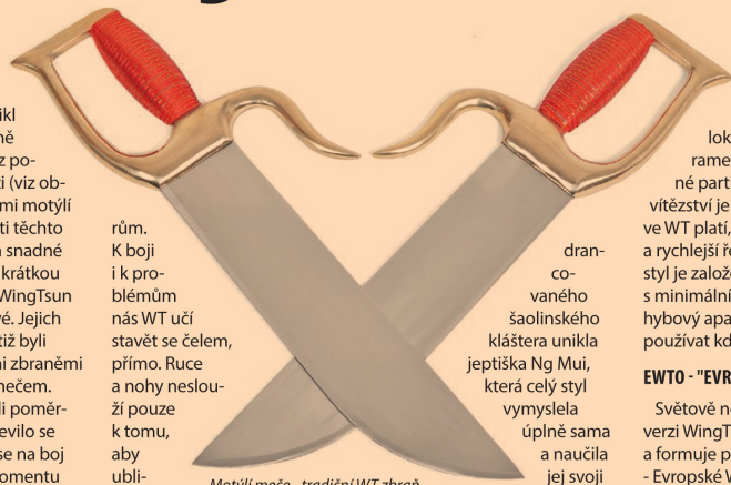
Motýlí meče - tradiční WT zbraň

WingTsun je právem považován za nejrychlejší bojové umění vůbec. Zkušení WT bojovníci zvládnou i více než deset úderů v jedné sekundě. Co je ale mnohem důležitější - první úder i pod desetinou sekundy. To je již hluboko pod reakční dobou člověka. Ovšem rychlost není pouze o úderech, je i o reakcích a komplexně o pohybech celého těla, které není třeba využívat jen k úde-