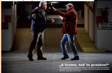
„A hrome, teď to praskne!“