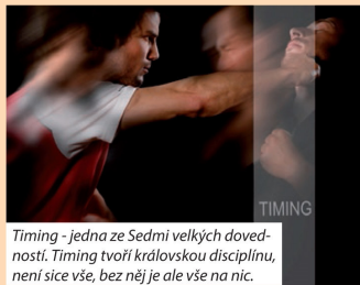
Timing - jedna ze Sedmi velkých dovedností. Timing tvoří královskou disciplínu, není sice vše, bez něj je ale vše na nic.

fyzické napadení. Samozřejmě to není jediný způsob, jak dochází k boji, ale je to u nás ten nejčastější a jeho scénář se liší od scénářů, které nastávaly v době, kdy se tradiční WingTsun vyvíjel. Liší se především způsoby útoků, liší se vzdálenost. A hlavně, málokdy jde opravdu o život. Pokud o něj není žádný čas na taktizování a přemýšlení, člověk reaguje instinktivně. Blitz De-