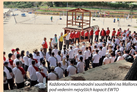
Každoroční mezinárodní soustředění na Mallorce pod vedením nejvyšších kapacit EWTO